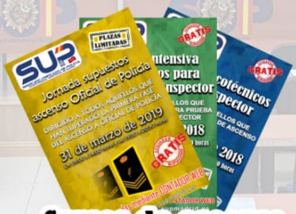
Cursos de ascenso