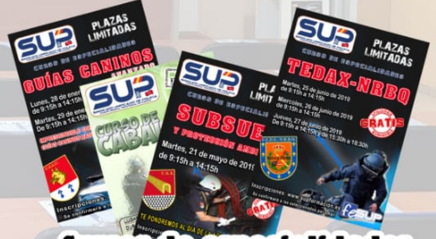
Cursos de especialidades