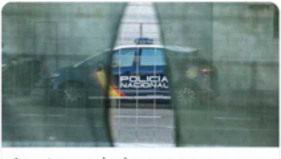
Agentes en pie de guerra para conseguir un gimnasio en el mayor... vozpopuli.com

SUP MADRID @supmadrid · 17/3/19 Gran esfuerzo de @SupMadrid por el Complejo Policial de Canillas, donde recopilamos firmas para la instalación de un gimnasio para tod@s l@s policías, no solo del Complejo, si no de Comisarias cercanas vozpopuli.com/espana/complej... #SUP #SupFomentaElDeporte