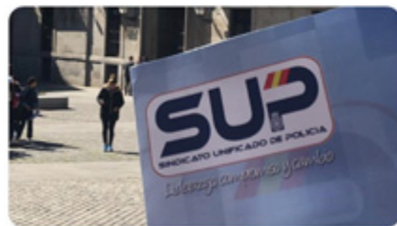
SUP MADRID y SUP

SUP MADRID @supmadrid · 15/3/19 Hoy @supmadrid se reúne con el teniente de Alcalde del Ayuntamiento de MADRID para evitar el cierre del Centro de Apoyo de Seguridad (CAS), y buscar soluciones de aparcamiento en Madrid Central, tb para el edificio JSP Madrid y Dehesa la Villa. #SupMadridDefiendeTusDerechos