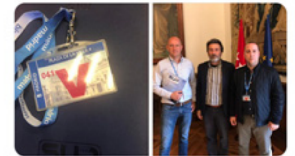
SUP MADRID y 3 más

SUP MADRID @supmadrid · 15/3/19 Agradecemos la predisposición del teniente de Alcalde del Ayuntamiento de Madrid a reunirse y escuchar las propuestas de @supmadrid. En breve informaremos con una circular