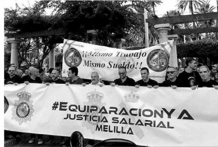
Una manifestación en Melilla de policías y guardias civiles reclamando la equiparación salarial con Cuerpos autonómicos.

“Hasta aquí hemos llegado. Zoido mentía. Y hoy (por ayer), en lo que ya anunciamos es el final de la negociación para alcanzar la equiparación salarial, se ha